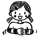
左手はグー、右手はパーにして左手を包む