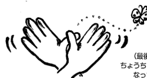
(最後) ちょうちょになっちゃったー