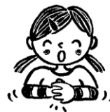
右手はグー、左手はパーにして右手を包む