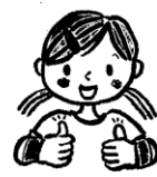
両手の親指を立てる。最後の「パッパッ」は両手をパーにする