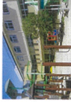
浜松駅に一番近いなのはな保育園