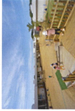
2020年4月上島から初生に移転したたんぽぽ保育園

そして、1996年4月、たんぽぽ保育園と同じように1300人以上の方々の協力を受けて芳川の里が設立され、運営は、上記2つの柱を理念にかかげ行っています。さらにその後、なのはな保育園、いしはらの里、はらっぱ保育園と設立の経過の違いはありますが、社会福祉法人たんぽぽ会の理念に基づき実践し努力を積み重ねています。