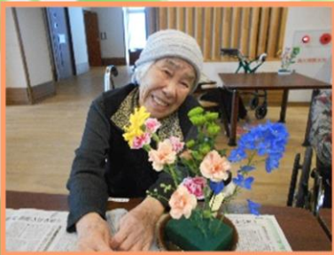
いい笑顔、いただきましたっ！