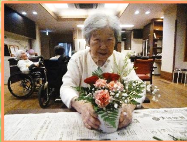
みなさんお上手です！

職員と一緒に生け花を楽しみました！ みなさんとてもお上手です！ 生けたお花は、母の日のプレゼントを兼ねて皆さんへ。せっかくなので男性の入居者様にも😊の写真を、各ユニットの生け花の時の様子です。